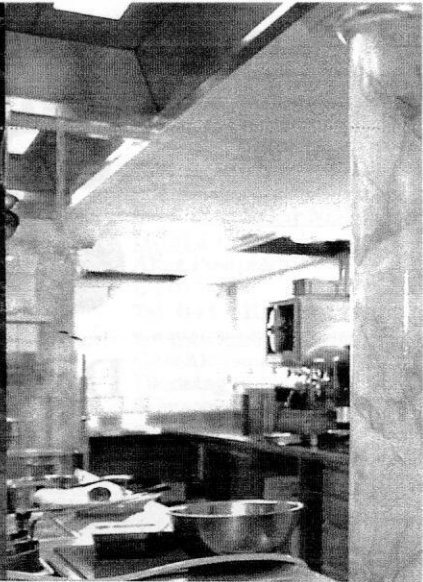
IN DEN «KAISERSTOCK» nach Riemer fest ist. Doch die Fahrt lohnt sich auf jeden Fall.