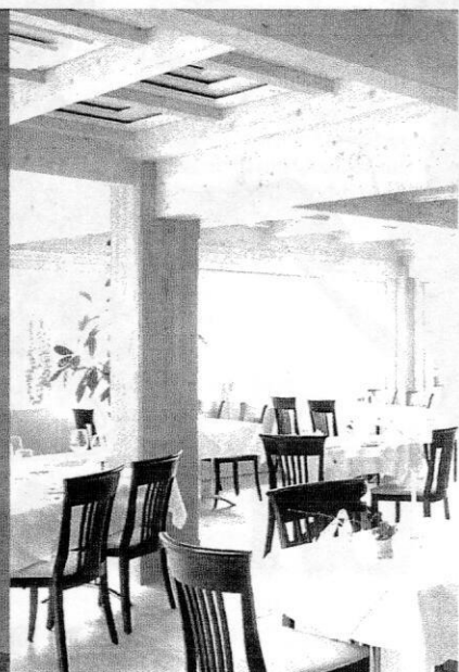
DIE WIRTSCHAFT zum Schweizerhaus ist die grossartige Freundlichkeit des Personals.